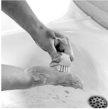
Josef, Azubi Mechatroniker

Beschreiben Sie welche Gefahren für die Haut in den folgenden Filmbeispielen dargestellt werden und wie man die Haut davor schützen kann.