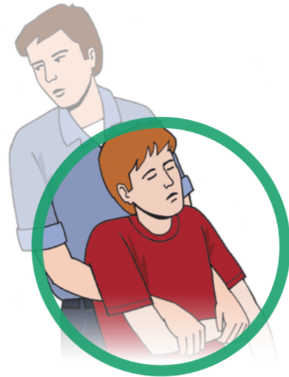
Person ggf. aus dem Gefahrenbereich retten